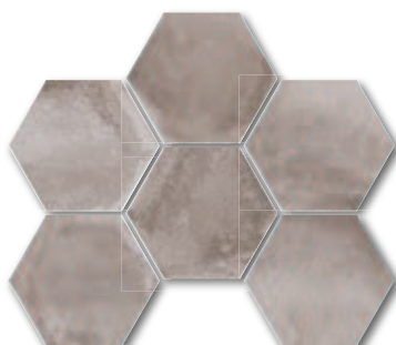
Cemento esagona A4362C1B 21x18,2 / PEI 5 999 Kč/m 2 • 39,63 €/m 2