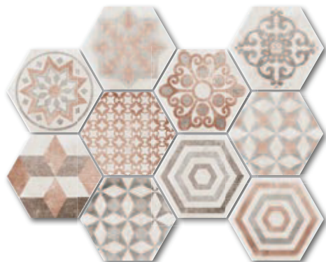
Decoro esagona Epoque A4365C1D 21x18,2 / PEI 4 1 190 Kč/m 2 • 47,21 €/m 2