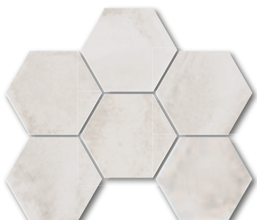
Calce esagona A4363C1B 21x18,2 / PEI 5 999 Kč/m 2 • 39,63 €/m 2