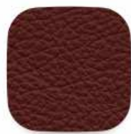
166 tmavě červená/bordó