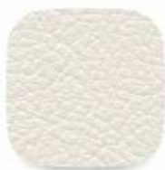
179 světle béžová