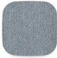
07 tmavě šedá