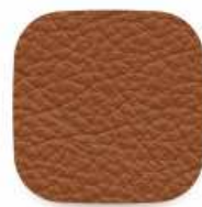
165 světle hnědá