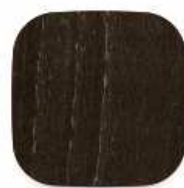
M05 buk mořený na wenge