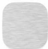
K01 nerez broušená