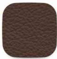
167 tmavě hnědá