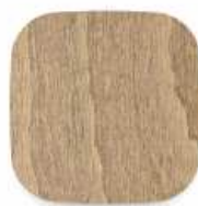
M04 buk mořený na světlý ořech