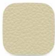
151 tmavě béžová