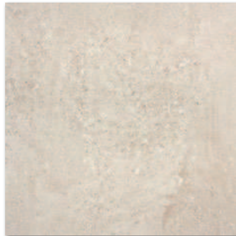
Hnědá nat, R10, A A1724B1A 60x60 / PEI 5 779 Kč/m 2 30,92 €/m 2