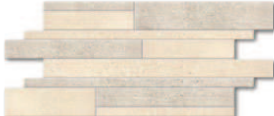
Mozaika Muro Z béžová reliéf + hnědá nat A1723A3AE5 30x60 3 290 Kč/m 2 (592 Kč/ks) 130,51 €/m 2 (23,49 €/ks)