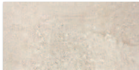
Hnědá nat, R10, A A1724A1A 30x60 / PEI 5 617 Kč/m 2 24,49 €/m 2