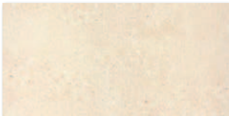
Běžová nat, R10, A A1723A1A 30x60 / PEI 5 617 Kč/m 2 24,49 €/m 2