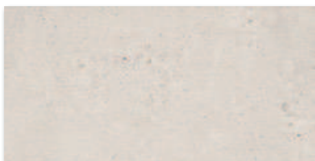
Slonová kost A1F2A2A1 30x60 617 Kč/m 2 24,49 €/m 2