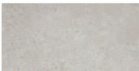
Světle šedá A1F2C2A1 30x60 617 Kč/m 2 24,49 €/m 2