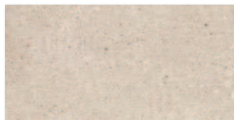
Běžová A1F2B2A1 30x60 617 Kč/m 2 24,49 €/m 2