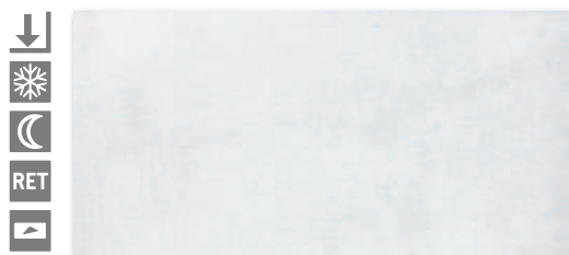
Sv. šedá naturale, R9 A1832B1A 30x60 556 Kč/m 2 • 22,06 €/m 2

Designy betonu jsou dnes „trendy“. Když tyto materiály přicházely na trh, mnozí si říkali, proč bychom na beton lepili dlaždice s designem betonu? Staré prostory s patinou nic nenahradí. Pro vytvoření atmosféry a kontrastu se začaly používat stěrky. Tyto materiály napodobovaly staré betony, ale měly lepší životnost a větší pevnost. Aplikace těchto materiálů je však složitá, cena ve srovnání s ostatními materiály je vysoká a při poškození se velice těžko opravují. Ze všech těchto důvodů jsou dlaždice s obdobným designem, rozumnou cenou, a především vysokou odolností, upřednostňovány před stěrkami. Série Loft je jedním ze zástupců s věrným designem, který je v moderní architektuře úspěšně používán.