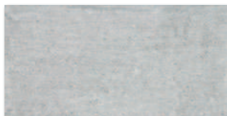
Šedá naturale, R9 A1833B1A 30x60 556 Kč/m 2 • 22,06 €/m 2