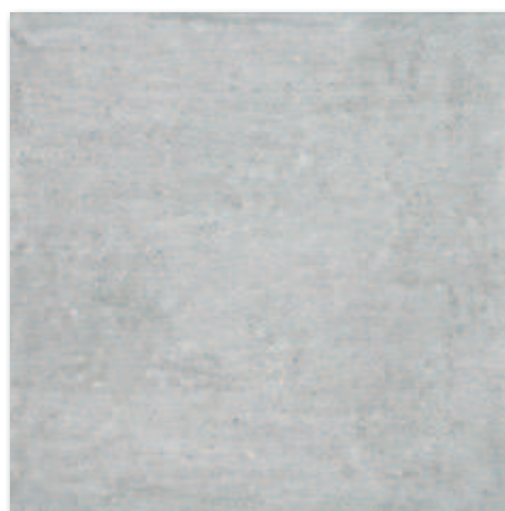
Šedá naturale, R9 A1833A1A 60x60 667 Kč/m 2 • 26,48 €/m 2