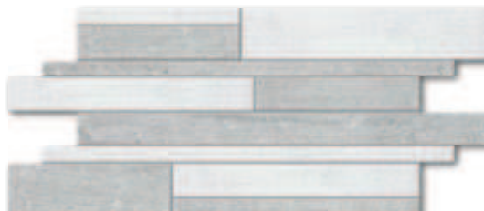
Mozaika Muro Z sv. šedá nat + šedá rel A1833B1AE5 30x60 3 290 Kč/m 2 (592 Kč/ks) 130,51 €/m 2 (23,49 €/ks)