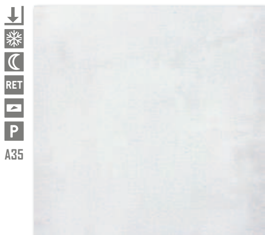
Sv. šedá naturale, R9 A1832A1A 60x60 667 Kč/m 2 • 26,48 €/m 2