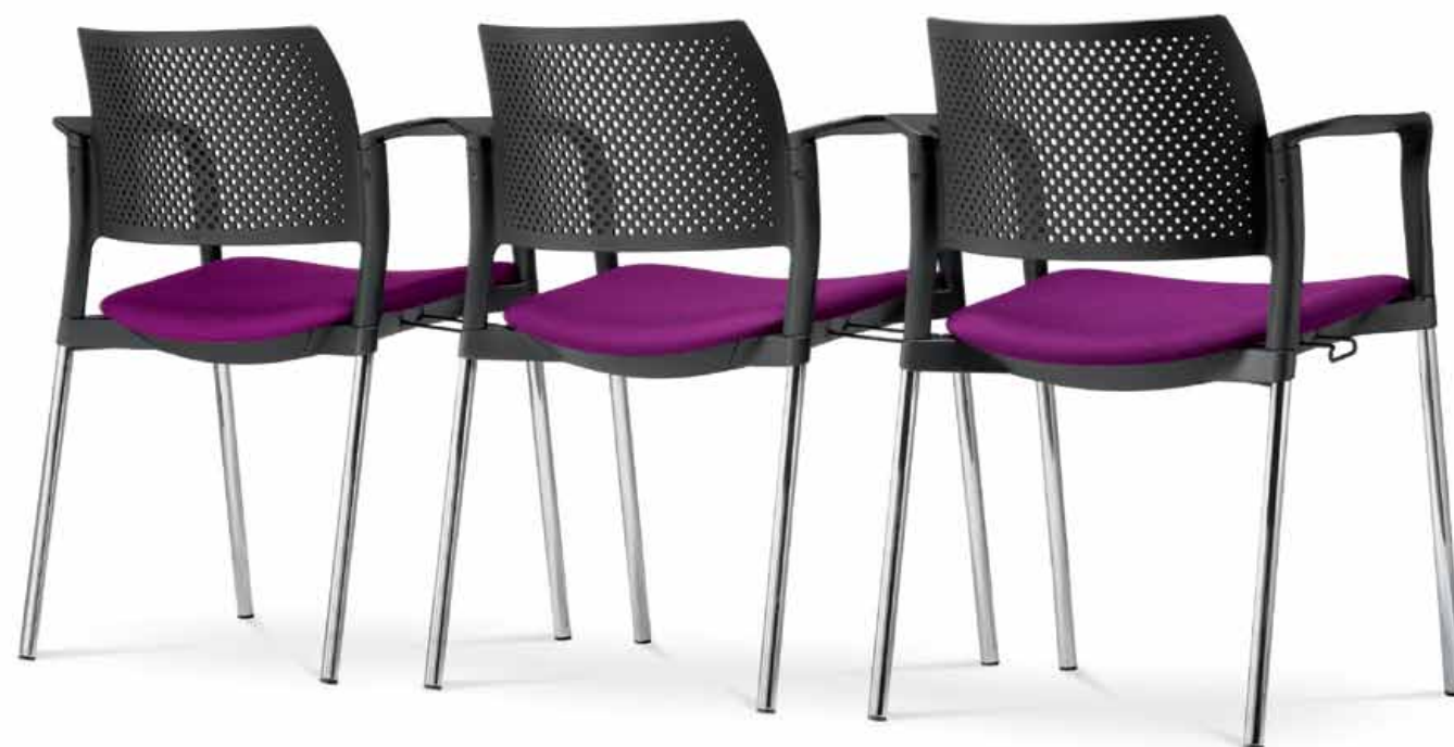
100-BL/B ■ + SR/B