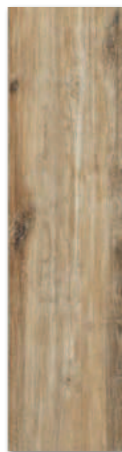
Oxid AVZ1A1A 22x85 / PEI 4 799 Kč/m 2 31,70 €/m 2