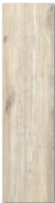
Musgo AVZ3A1A 22x85 / PEI 4 799 Kč/m 2 31,70 €/m 2