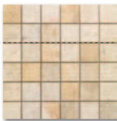
Mozaika Cubito naturale 30x30 386 Kč/ks (4 290 Kč/m 2 ) 15,32 €/ks (170,18 €/m 2 )