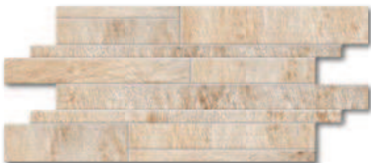
Mozaika Muro Z naturale 30x60 4 290 Kč/m 2 (772 Kč/ks) 170,18 €/m 2 (30,63 €/ks)