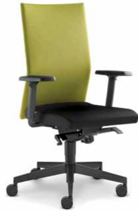
290-SYS ■ +BR-210