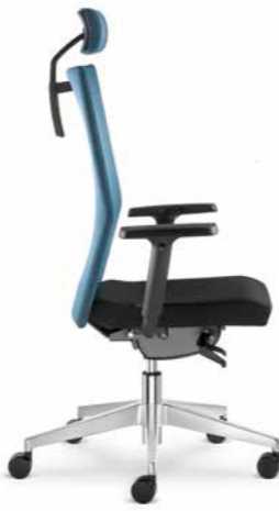
295-SYS ■ +BR-210

The backrest can be equipped with an adjustable lumbar support. (valid for models: 425, 405 and 400)