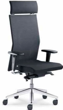
425-TI ■ +BR-550-N6