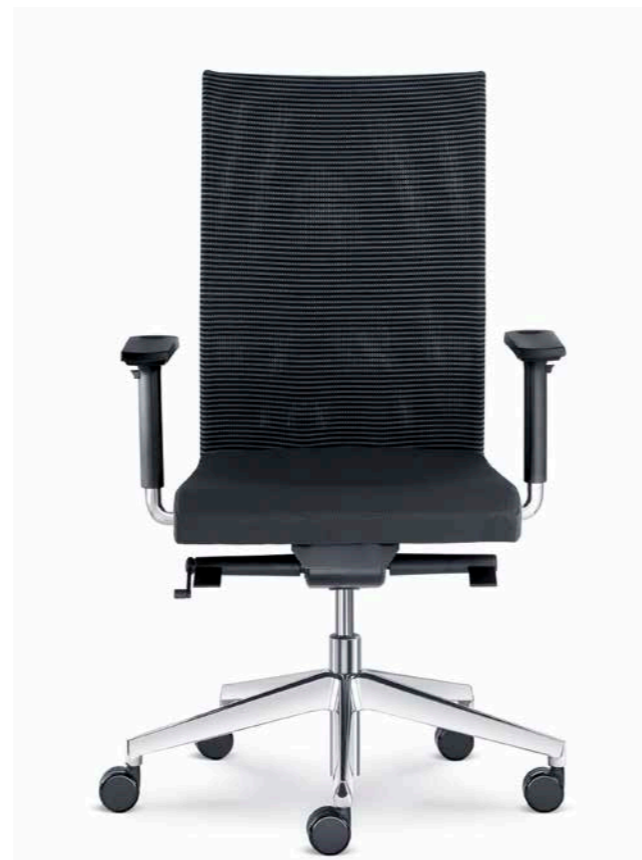
405-SYS ■ +BR-209-N6