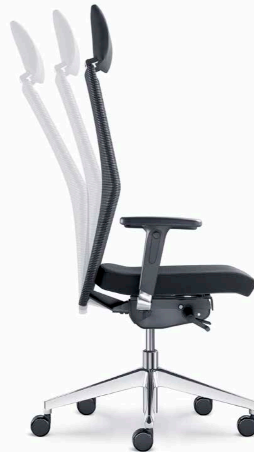
425-SYS ■ +BR-550-N6

Backrest angle setting and its synchronous motion with the chair seat, height-adjustable seat and optional adjustable functions such as the seat depth or angle setting independent of the mechanism movements are provided as a matter of course.