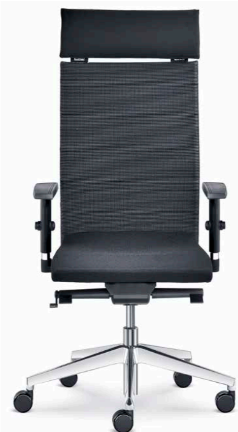
425-SYS ■ +BR-470-N4