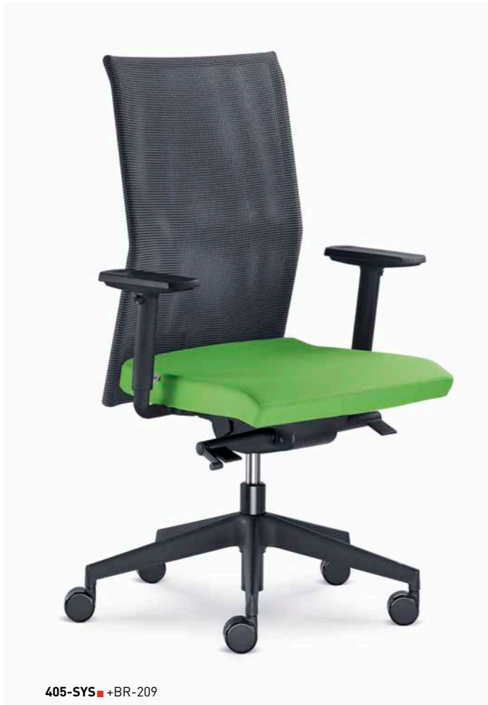
405-SYS ■ +BR-209