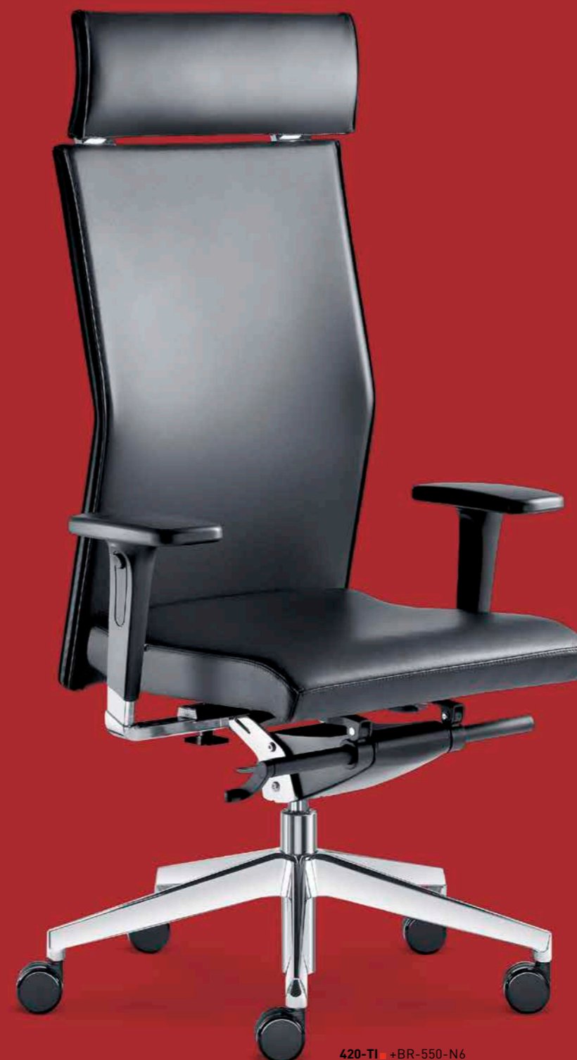
420-TI ■ +BR-550-N6