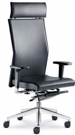
420-TI ■ +BR-550-N6