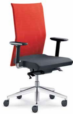
405-SYS ■ +BR-209-N6