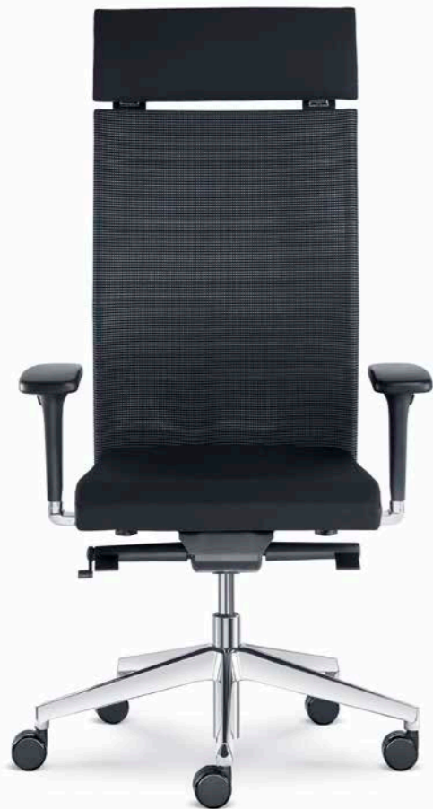
425-SYS ■ +BR-550-N6