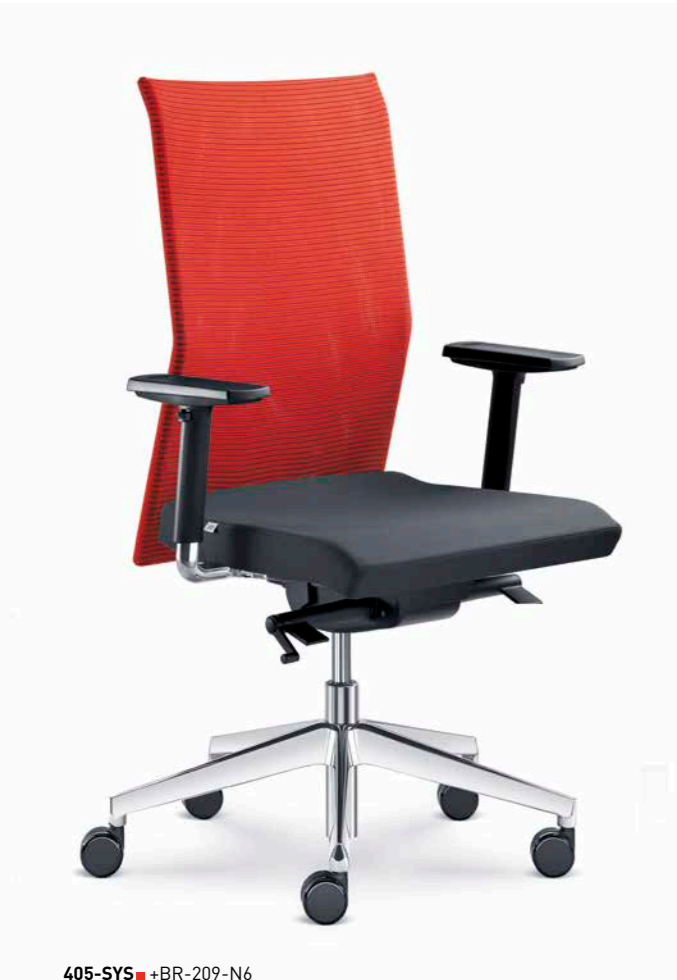
405-SYS ■ +BR-209-N6