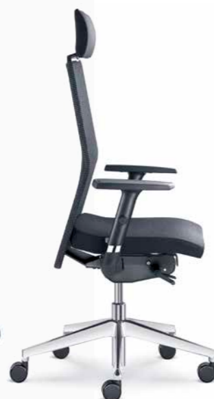
425-SYS ■ +BR-470-N4