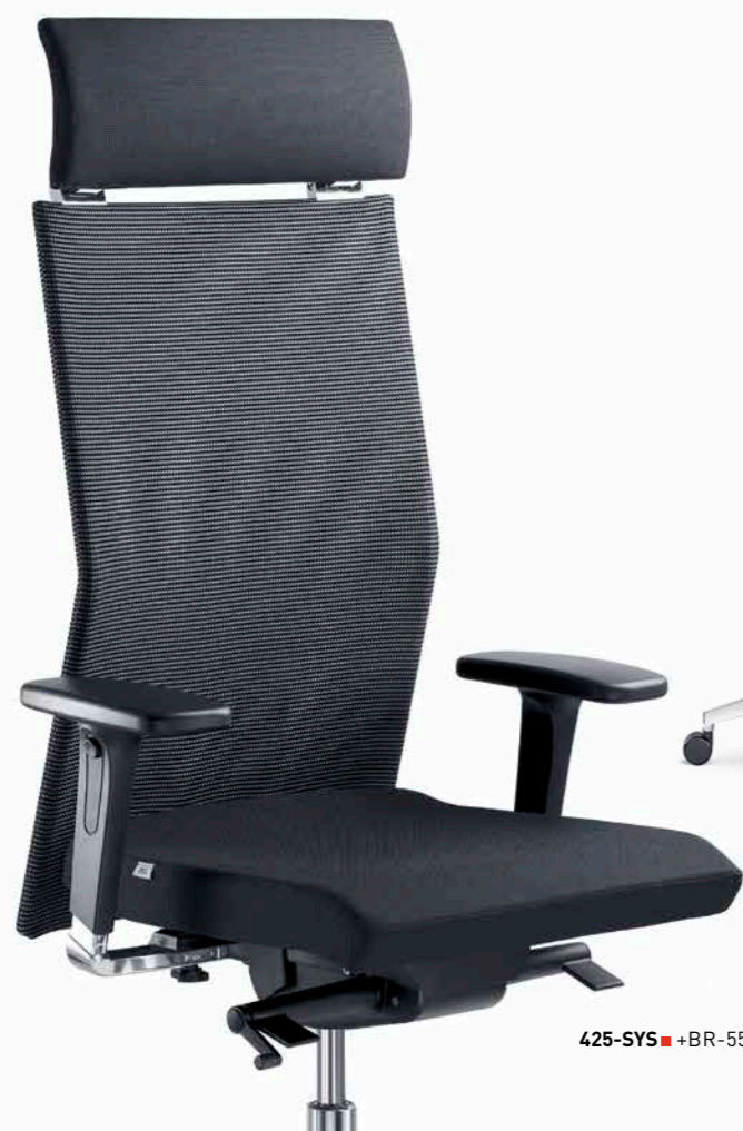
425-SYS ■ +BR-550-N6

Le dossier de WEB a été dessiné pour permettre une parfaite adaptation à la morphologie du dos de son utilisateur. La structure en tube d'acier est cintrée pour intégrer au mieux la courbure de la colonne vertébrale. Le capitonnage flottant exclusif en maille filer, tissu ou cuir de la série WEB permet au revêtement de prendre parfaitement la forme du dos de l'utilisateur.