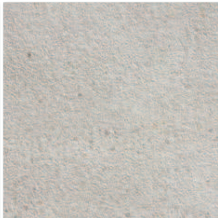
Světle šedá A1F2F3A1 60x60 1 336 Kč/m 2 • 53,00 €/m 2