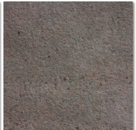
Černá A1F2G3A1 60x60 1 336 Kč/m 2 • 53,00 €/m 2