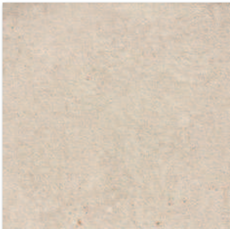
A35 Běžová A1F2E3A1 60x60 1 336 Kč/m 2 • 53,00 €/m 2